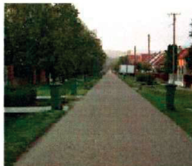
Slika 2. Izgled ulice sa plastičnim kantama

Podela kanti od 120 lit. je izvršena prema sledećoj šemi: 1-4 člana - 1 kanta, 5-7 člana - 2 kante, 8 > člana - 3 kante. Primenjen je i model gde kanta od 240 litara menja 2 kante od 120 litara. Dinamika odnošenja jednom nedeljno.