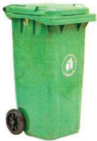
Slika 1. Plastična kanta za otpad

Stanovnici koji žive u individualnom tipu stanovanja (kuće) u gradu svoj otpad odlažu u kante. Kante su dodeljene svakom domaćinstvu na osnovu broja članova domaćinstva, putem ugovorene obaveze. Obaveza korisnika kante je da svoju kantu (ili kante) u dane odnošenja otpada iz njegove ulice donese do trase odnosno kolovoza, i to na udaljenost maksimalno 1,5m od ivice puta, kuda prolazi vozilo za sakupljanje otpada i da je nakon pražnjenja vrati.