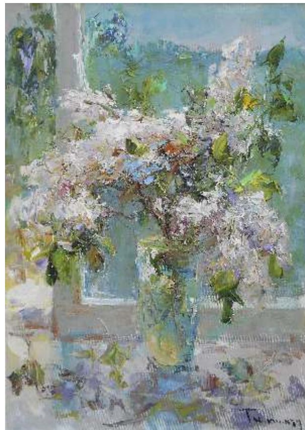
Tuman Žumabaev Rusija