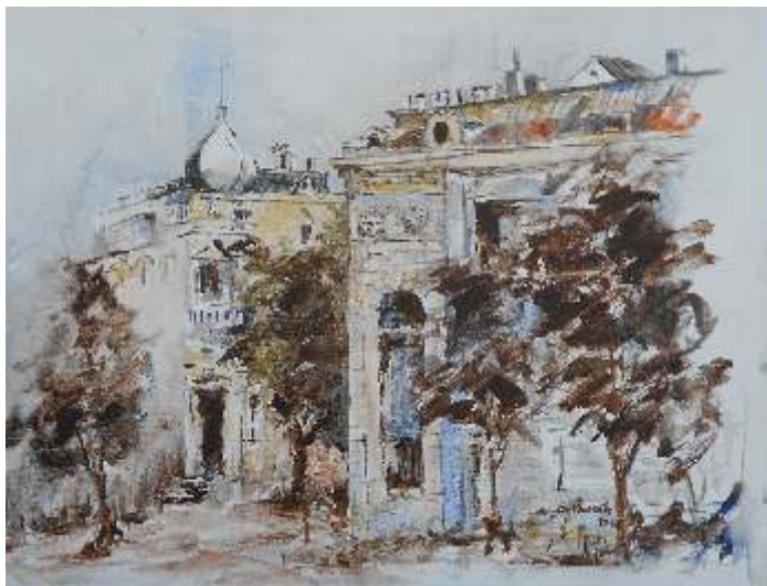
Dragan Tasić Srbija