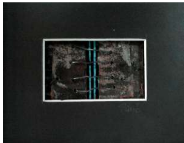
Željko Pavić kombinovana tehnika Hrvatska 6x10cm