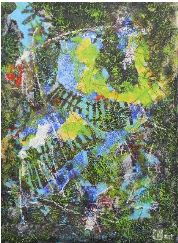
Clemens Beungkun Sou kombinovana tehnika Južna Koreja 60x80cm