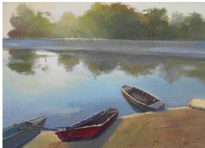
Selma Todorova Bugarska