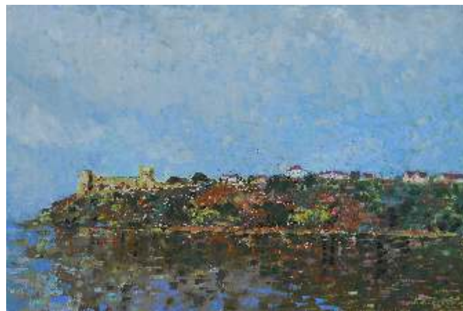
Snežana Bekrić Srbija