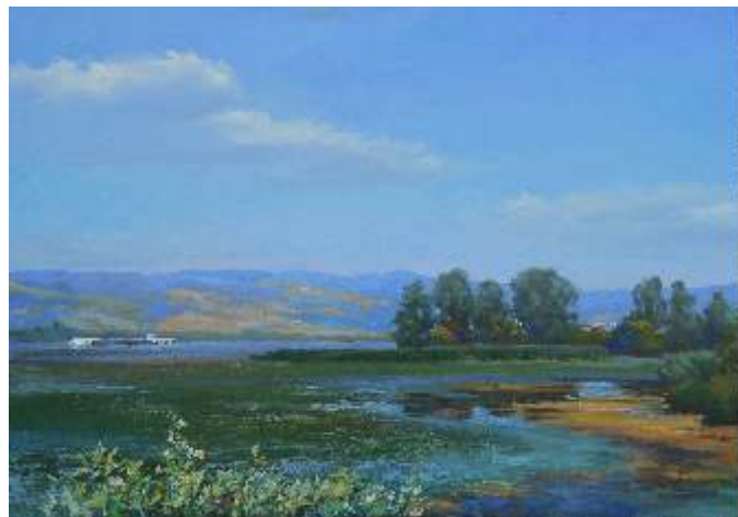
Viktor Novicki Belorusija