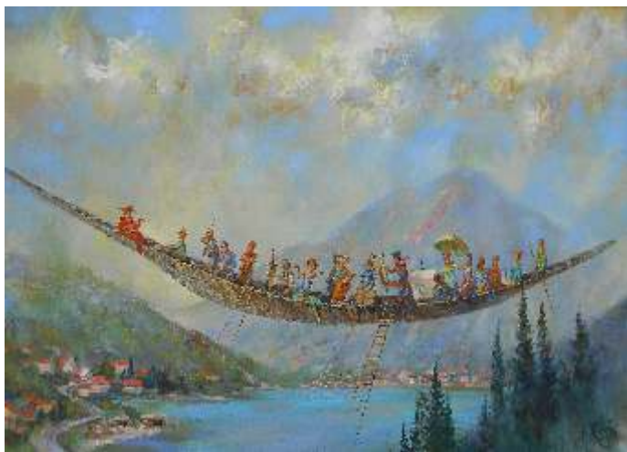
Anatoly Kontsub Belorusija