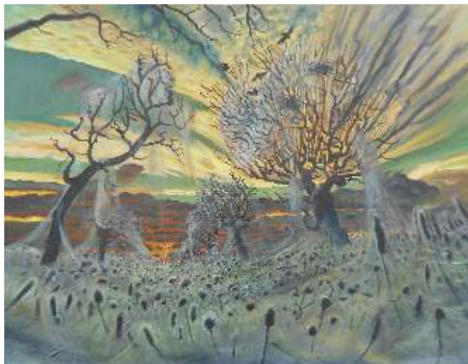
Saša Montiljo Srbija