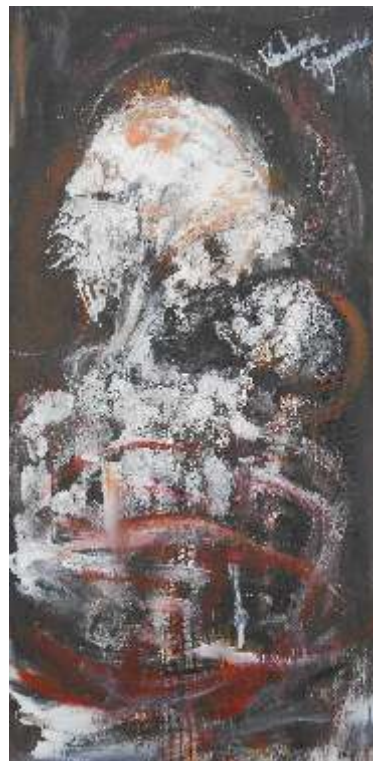
Teodora Stojanović Srbija ulje na platnu 50x100cm