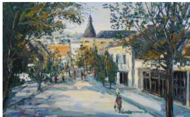
Đorđe Stanić Srbija