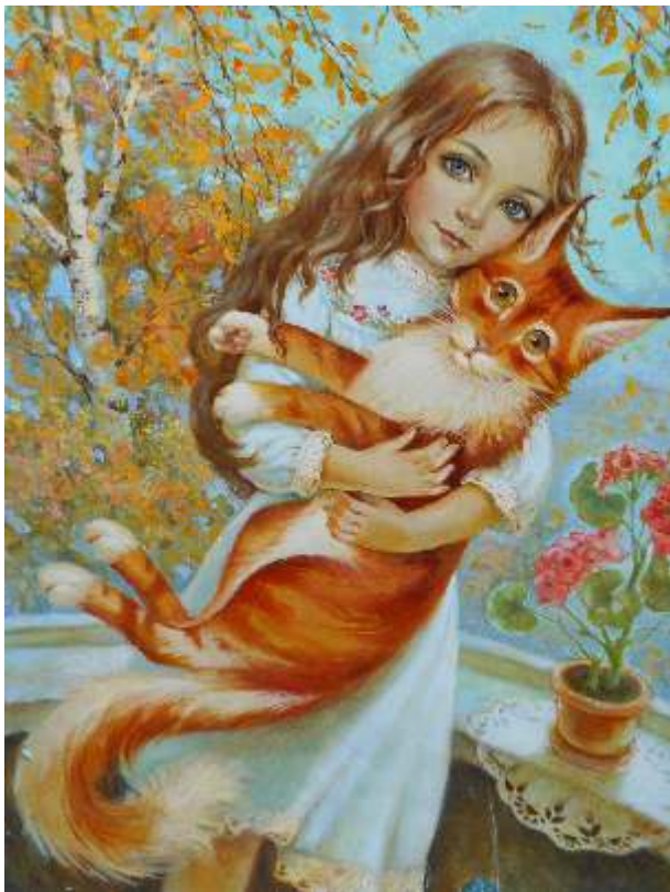
Galina Bodiakova Ukrajina