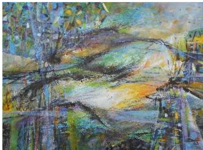
Dragana Bojić kombinovana tehnika Srbija 80x60cm