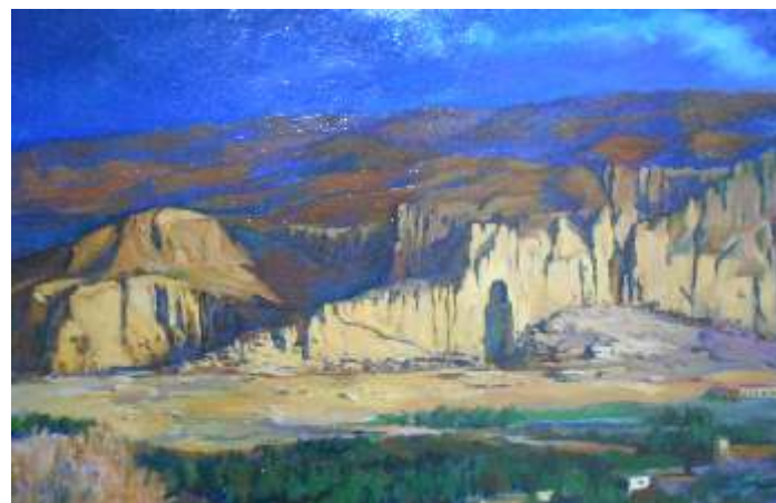
Zemar Said Avganistan