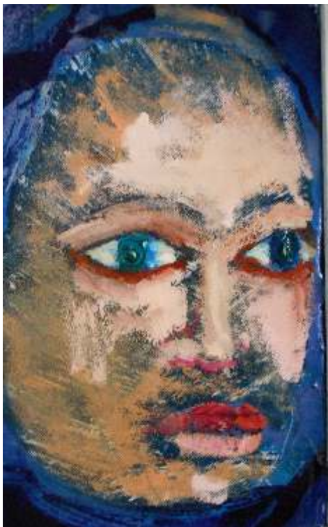
Snežana Milošević- Lavinija kombinovana tehnika Srbija 17,5x27,5cm