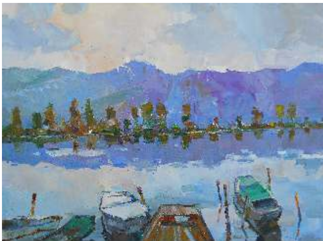
Egor Dulin Ukrajina