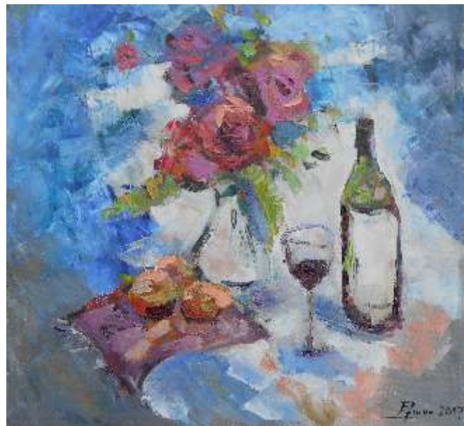
Ružica Stojadinović Srbija