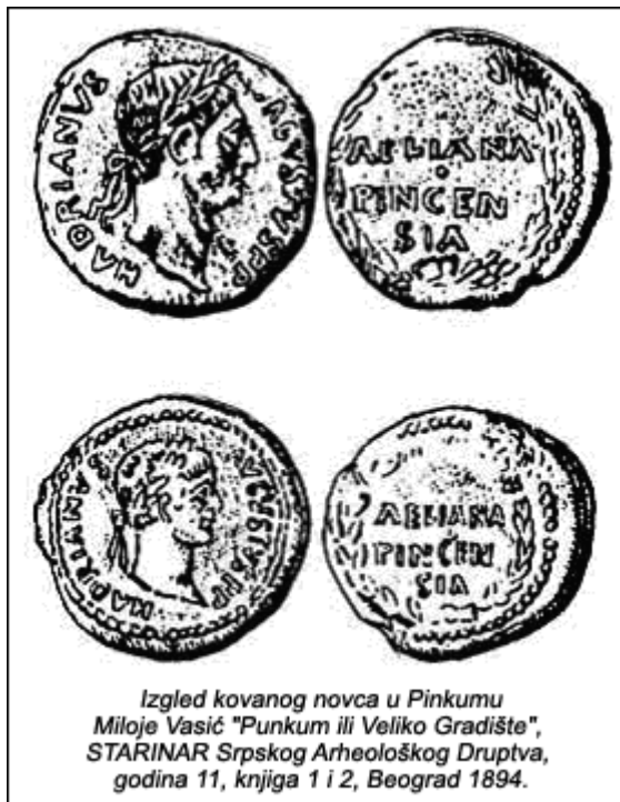
Izgled kovanog novca u Pinkumu Miloje Vasić "Pinkum ili Veliko Gradište", STARINAR Srpskog Arheološkog Društva, godina 11, knjiga 1 i 2, Beograd 1894.

У почетку свог оснивања и Пинкум као и остала насеља имала су сва исту важност. Али, богата долина поред реке и пут који је њоме водио издигли су овај мали градић. Свој највећи успон – своје златно доба овај град је доживео за време римског цара Хадријана. Наследивши ратоборног претходника, цара Трајана, Хадријана је мудрог владавином настојао да очува стечено богатство и сав се посветио унутрашњем уређењу земље. За разлику од Виминацијума који је био минципијум, Пинкум је уживао наклоност и самог цара, који га је и сам посетио око 117. године. Пинкум је у то време био рударски центар који је у административном погледу био изузет из управе провинцијског префекта и директно потчињен цару.